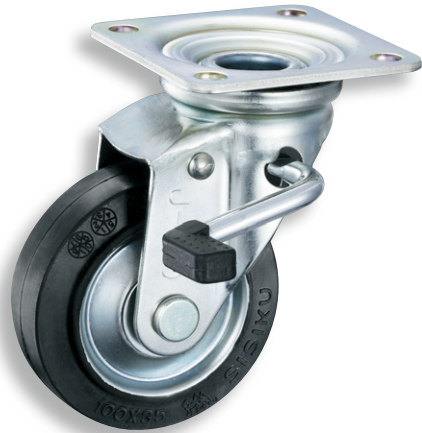
ゴム車輪 K-50S-100 Rubber wheel