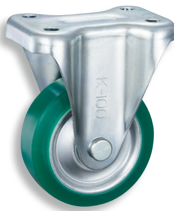
ウレタン車輪 K-520-100 Urethane wheel