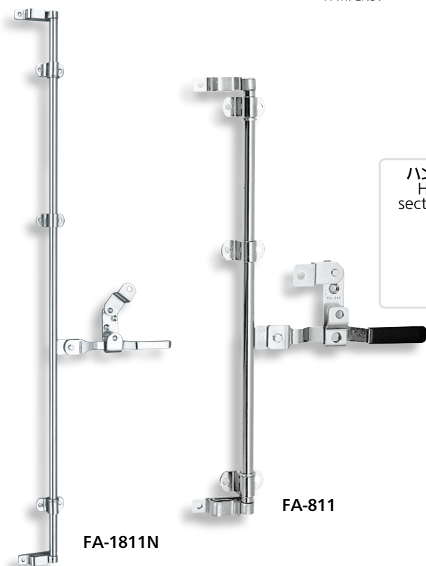
ハンドル断面寸法 Handle cross section dimension