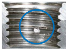
スパッタ付着 (GP:NG) Spatter