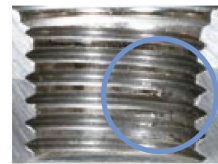
スパッタ除去 (GP:OK) Spatter