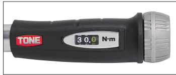
デジタル表示部分