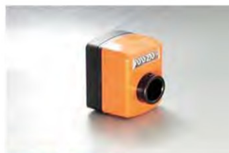
SDP09-N + SDP09-CP